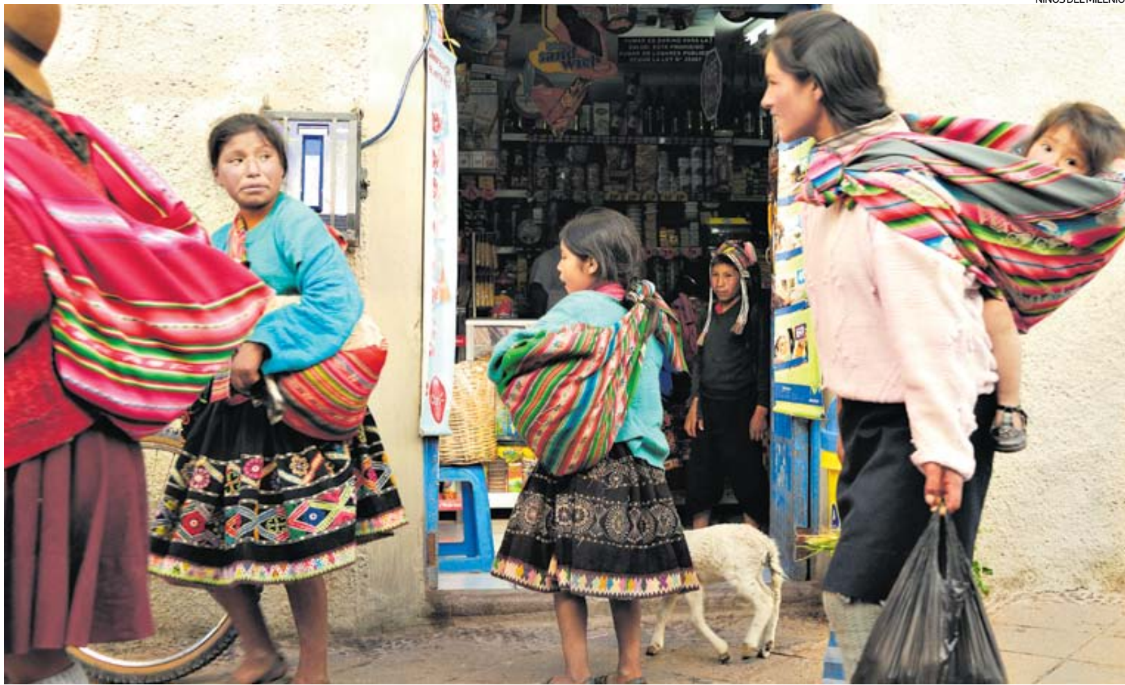
“NIÑOS DEL MILENIO”

Las principales mejoras se dieron en el acceso a bienes de consumo duradero y a servicios. La proporción de familias que tienen energía eléctrica aumentó de 60% a 96%, mientras que la cobertura de saneamiento pasó del 74% al 95%. La calidad de la vivienda es el factor que